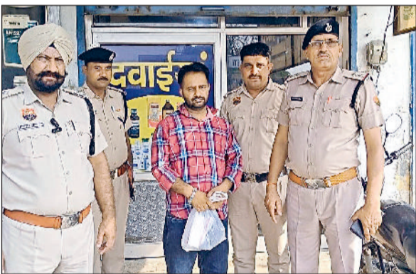
रतिया। दवाओं सहित पकड़ा गया युवक।