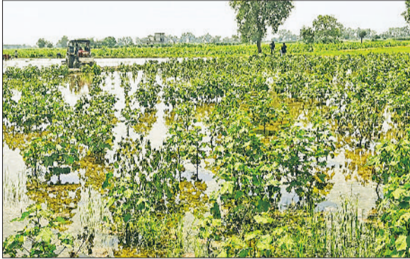
सिरसा। चोपटा खंड में खेतों में जमा हुआ बरसाती पानी।

सैकड़ों एकड़ फसल नष्ट हो गई। के किसानों के लिए क्षतिपूर्ति पोर्टल