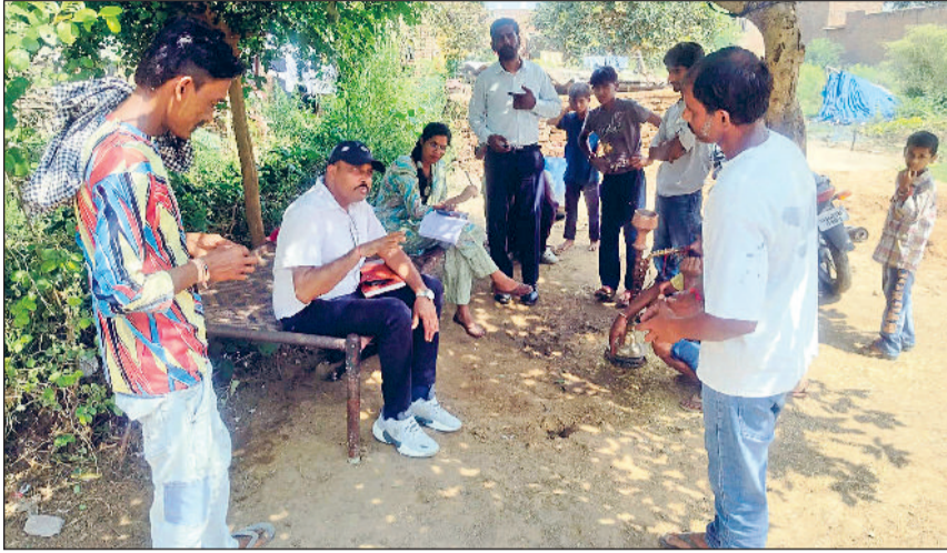
फतेहाबाद। लोगों को नशे के खिलाफ जागरूक करती नशामुक्ति टीम।