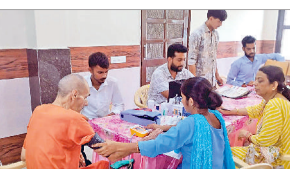
फतेहाबाद। मेडिकल कैम्प में बुजुर्गों के स्वास्थ्य की जांच करते कर्मचारी।