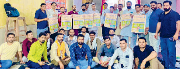
सिरसा। बैठक करते कर्मचारी।