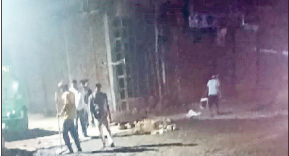
सिरसा। सीएम आगमन को लेकर पैचवर्क करते कर्मचारियों।