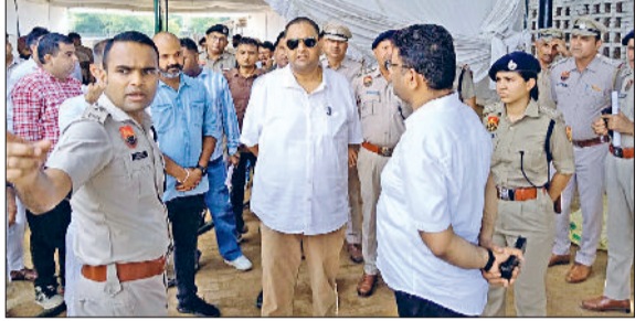
फतेहाबाद। गांव बड़ोपल में मुख्यमंत्री के कार्यक्रम के मद्देनजर व्यवस्थाओं का जायजा लेते प्रशासनिक अधिकारी।