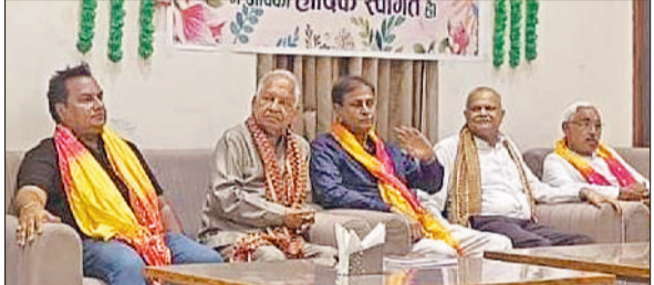
सिरसा। मिलन समारोह में भाग लेते वरिष्ठ नागरिक।