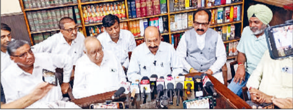
सिरसा। पत्रकारों से बातचीत करते जिला बार एसोसिएशन के प्रधान व अन्य।

काँल पर पूरे हरियाणा की बार में वर्क सस्पेंड कर दिया, जिससे प्रदेश भर की कोर्ट में कार्रवाई बंद हो गई और आम जनता को भी परेशानियां झेलनी पड़ रही थी। प्रदेश की बार में वर्क सस्पेंड के बाद सरकार व अधिवक्ता हरकत में आए।