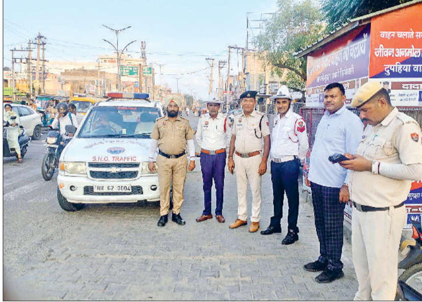
फतेहाबाद। लाल बत्ती चौक पर चैकिंग करते ट्रैफिक पुलिस कर्मचारियों।